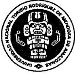
Imagen Institucional, Cooperación Técnica y Relaciones Internacionales – Oficina de Enlaces Internacionales para fines estadísticos y de seguimiento.