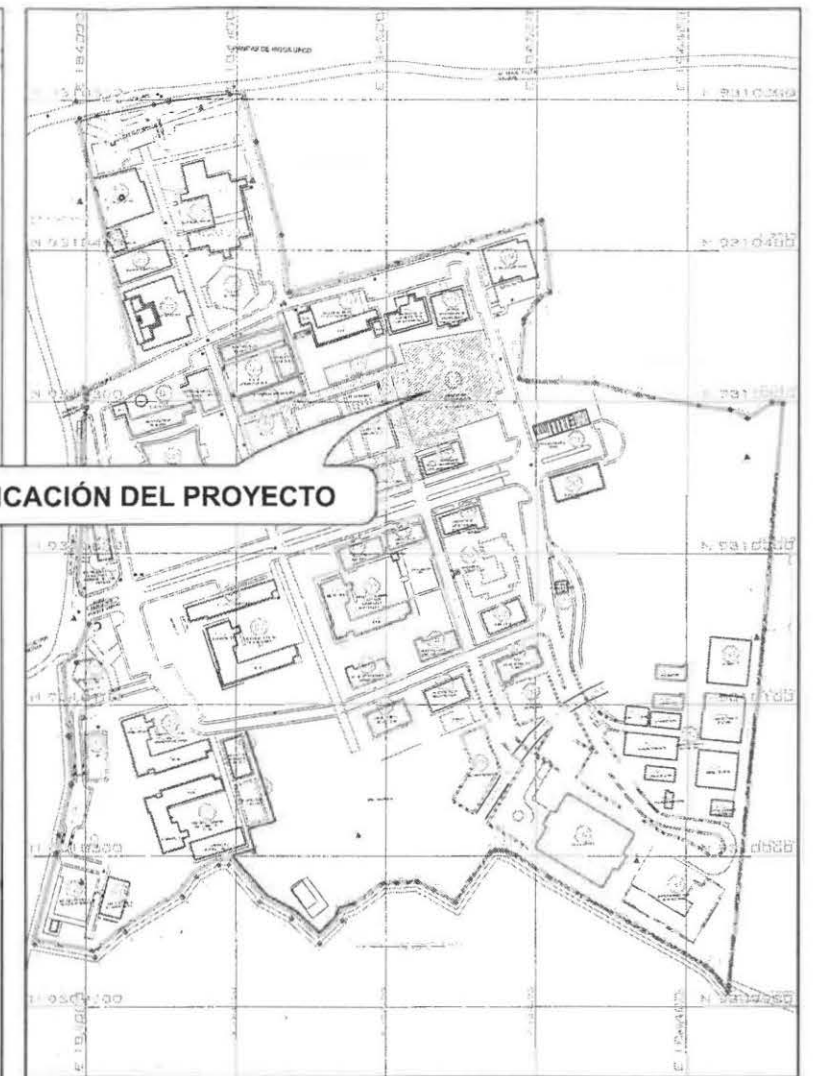
PLANO DE LOCALIZACIÓN Esc: 1/5000